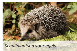
Schuilplaatsen voor egels