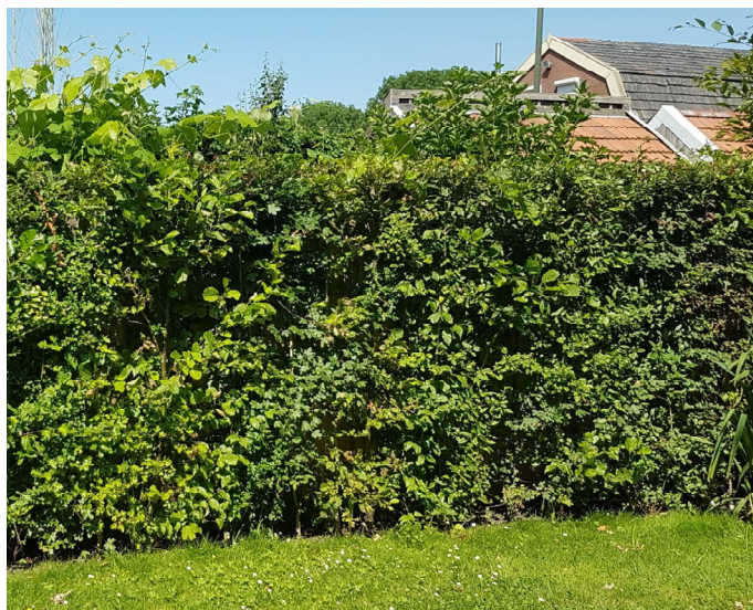
Gemengde haag als natuurlijke overgang naar het landschap

Op plekken waar achtertuinen aan de openbare ruimte grenzen mag de groene afscheiding tot 1.80 meter hoog worden. Voor deze locaties mag zowel voor een haag als voor hekwerk, al dan niet geluidwerend, met klimplanten gekozen worden. Houd met het maken van deze keuze rekening met de voordelen van een haag.