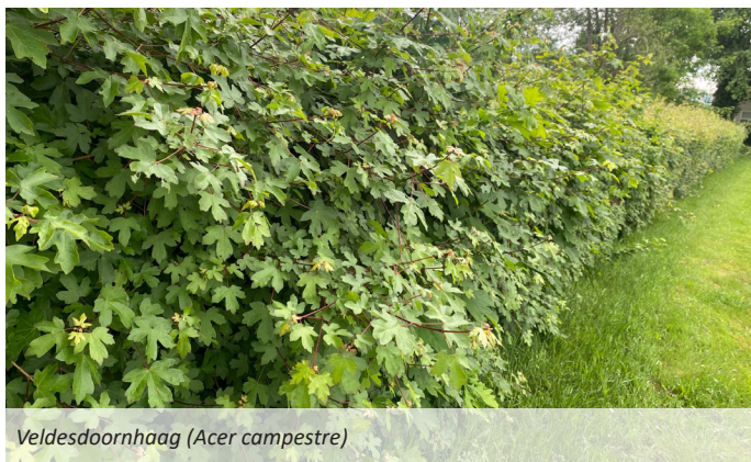
Veldesdoornhaag (Acer campestre)