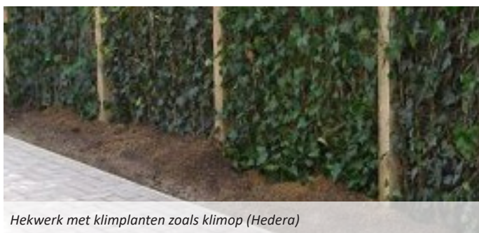
Hekwerk met klimplanten zoals klimop (Hedera)