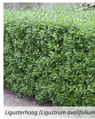
Ligusterhaag (Ligustrum ovalifolium)