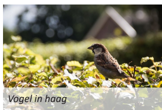
Vogel in haag