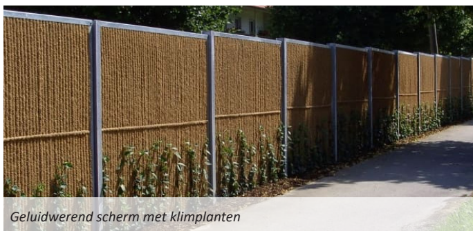
Geluidwerend scherm met klimplanten